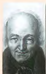
N° 12 RENÉ-JUST HAÛY 1742 - 1822 Date clef : 1772

parfois déconcertante ; il raconte régulièrement où il était préférable d'acheter les meilleurs vins, semble-t-il indispensables à ses pérégrinations... La volonté d'entreprendre un septième périphe le décida à quitter Paris à la révocation de l'Edit de Nantes (1685), il se dirigea alors vers la Moscovie où il est dit qu'il décéda. Jean-Baptiste Tavernier, précurseur du commerce avec les Indes, n'avait ni l'esprit, ni le goût, ni l'instrumentation nécessaire d'un voyageur scientifique. Mais pour tout sujet afférent au négoce et à la diplomatie, sa connaissance extraordinaire des routes terrestres orientales choisies, des écueils à éviter, son acuité ethnologique, sociale et économique firent de ses récits des guides indispensables pour des générations de voyageurs et permirent le développement de relations politiques avec les plus grands monarques orientaux.