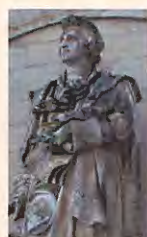
JEAN-BAPTISTE LOUIS ROME DE L'ISLE 1736 - 1791 Date clef : 1772