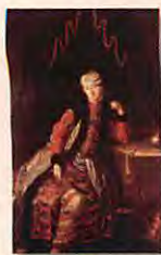
N° 11 JEAN-BAPTISTE TAVERNIER 1605 - 1689 Date clef : 1676

Par ses opinions et ses théories, le « Gemmarum et Lapidum Historia » devint la source des chercheurs du XVIII ème siècle, véritable pivot dans l'articulation de l'histoire des savoirs gemmologiques et minéralogiques.