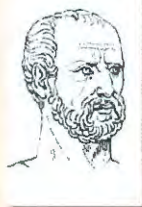
N° 10 ANSELME BOECE DE BOODT 1550 - 1632 Date clef : 1609

Anselme Boece de Boodt naît à Bruges en 1550. Il étudie la philosophie d'Aristote à Louvain. Licencié en droit canon à Orléans, il suit des cours de médecine à Padoue. En 1581, il est à Heidelberg où Thomas Eraste lui prodigue des leçons. En 1582, il rencontre Rodolphe II (1552-1612) qui devient son mécène. Attaché en 1600 à la cour de Prague en tant que « gemmologue », il est nommé médecin personnel par l'empereur. Après le décès de son protecteur en 1614, de Boodt préfère rentrer définitivement à Bruges où il s'éteint en 1632. L'édition princeps de son œuvre « Gemmarum et Lapidum Historia » datée de 1609 eut un succès retentissant dès sa publication et gouverna la compréhension des gemmes pendant près de deux siècles. La valeur encyclopédique naturaliste de l'ouvrage est considérable. De Boodt, adossé à la tradition des anciens Lapidaires, réussit à présenter ses propres convictions, amalgamant les discours épars de ses prédécesseurs, tout en conciliant l'inaliénable aristotélisme, la foi et la raison, Dieu et la science, dressant ainsi une autopsie humaniste fondamentale de la gemmologie.